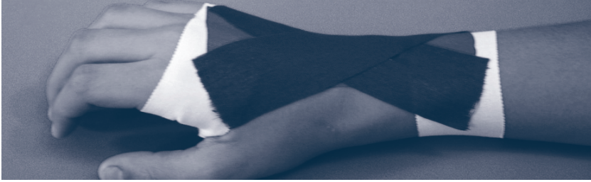
Figura 4. Vendaje funcional del esguince de muñeca