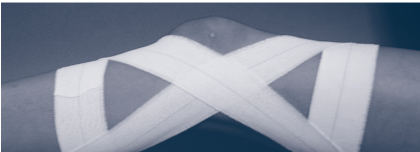
Figura 3. Vendaje funcional del esguince de rodilla