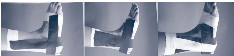
Figura 1. Vendaje funcional de tobillo

La más utilizada es la tobillera elástica con banda pronadora, aunque hay otras como la tobillera con cordones, útil también para evitar lesiones durante la práctica deportiva en pacientes con esguinces de repetición o la ortesis con bandas rígidas laterales tipo Aircast® que proporciona mayor sujeción y puede sustituir a la inmovilización con escayola en los esguinces grado III.