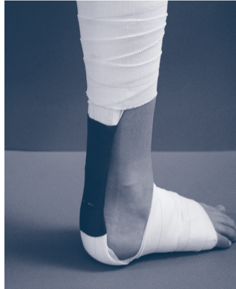
Figura 2. Vendaje funcional de la tendinitis aquilea