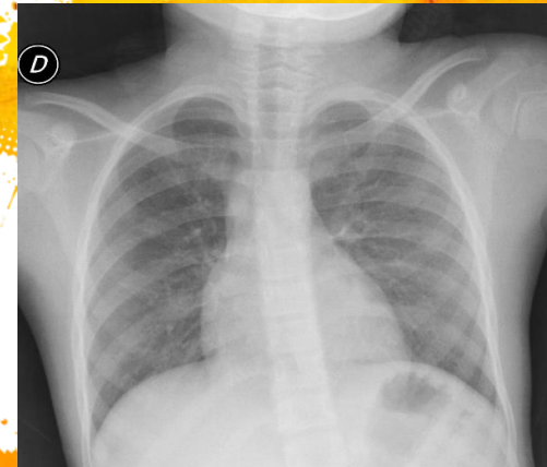
Radiografía de tórax AP: sin alteraciones